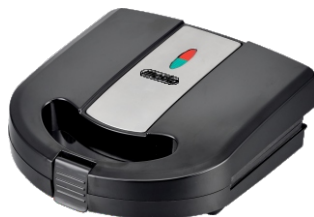
Sandwich Maker MS 3045