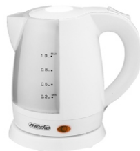
Electric Kettle MS 1276