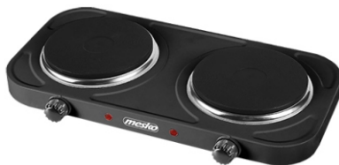
Double hot plate MS 6509