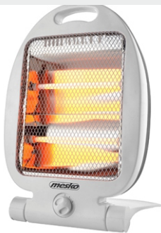
Quartz Heater MS 7710