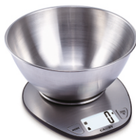
Kitchen Scale MS 3152