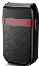
Hair Shaver AD 2932