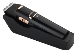
Hair Clipper AD 2832