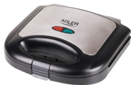
Sandwich maker AD 3015