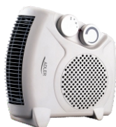
Fan Heater AD 77