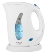
Electric Kettle AD 02