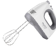
MIXER CR 4220