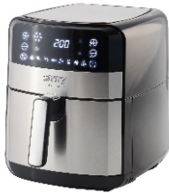
AIR FRYER OVEN CR 6311