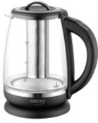
ELECTRIC KETTLE CR 1290