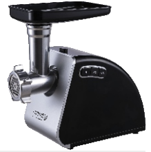
MEAT MINCER CR 4812