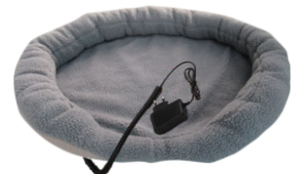
HEATED ANIMAL DEN CR 7431