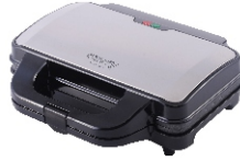
SANDWICH MAKER CR 3054