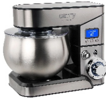
FOOD PROCESSOR CR 4223