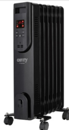
OIL FILLED RADIATOR CR 7812