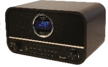
RETRO RADIO CR 1182