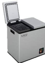
PORTABLE FRIDGE CR 8076