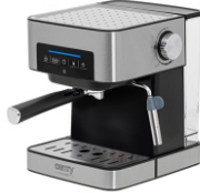
ESPRESSO MACHINE CR 4410