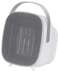
CERAMIC FAN HEATER CR 7732