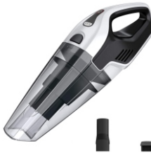
BAGLESS VACUUM CLEANER CR 7046